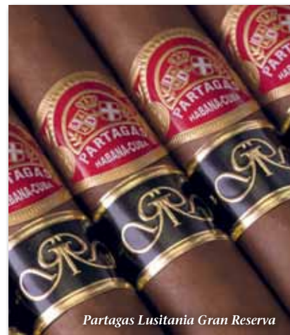
Partagas Lusitania Gran Reserva