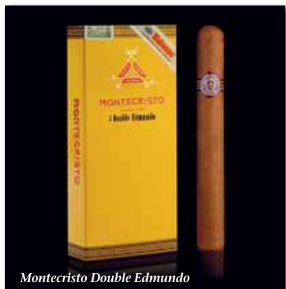
Montecristo Double Edmundo

Am Dienstagabend startete das Festival mit der „Noche de Bienvenido“, die in diesem Jahr in der Hafenfestung „El Morro“ stattfand. Diese ist wegen ihres „Cañonazo de las nueve“ bekannt. Damit wird der legendäre Kanonenschuss bezeichnet, der auch heute noch exakt um neun Uhr abgefeuert wird und in Alt-Havanna gut zu hören ist. Früher schloss man zu diesem Zeitpunkt die Hafeneinfahrt von Havanna und gab dies so bekannt. Hier präsentierte Habanos S.A. eine der wichtigsten Neuheiten des Jahres: die Montecristo Double Edmundo. Diese Cigarre hat das Format Doble mit einer Länge von 155 mm und einem zeitgemäß üppigen 50er Ringmaß. Es wird das dritte und künftig größte Format der Edmundo-Linie sein. Erstmals finden wir auf dieser Cigarre einen neuen Cigarrenring, der deutlich wertiger gestaltet ist und der weltberühmten Habanosmarke noch besser entspricht. Die Lilie und weitere Verzierungen des Rings sind jetzt in einem edel wirkenden Rotgold ausgeführt und deutlich geprägt. Es ist geplant, diesen Ring nach und nach für alle Cigarren der Marke zu verwenden. Jeder Teilnehmer erhielt außerdem eine Montecristo Petit No.2, eine weitere Neueinführung dieses Jahres. Dabei handelt es sich um eine Figurado, sozusagen die kleine Schwester der Montecristo No.2. Ihre Länge beträgt 120 mm bei einem 52er Ringmaß. Fortsetzung Seite 3